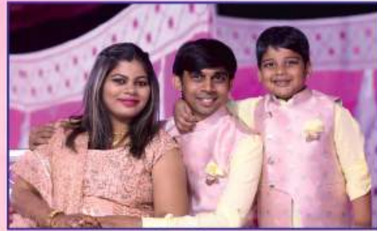
રીડલ હીરેન છેડા (કહાન)